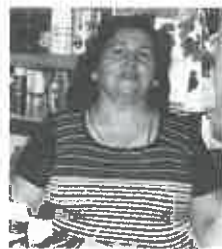
המקום בקרא פעם רמת יצחק. היביתי שנה וחצי לזכות להחיי שוב כאן. באנו, ראינו פרדס יבש. יתר דים אמריקאיים נתנו כסף. לא ידעו לבנות ובנו כמו תוחמים. עשו שגיאות בלי סוף. לא ידעו אישה לטלול, בזמן מלחמה. זה כמו מקלט - הכל בטון. זרקו אותנו

לכאן בלי השמל. את החלון עשינו בעצמנו - זמי שעשה את חברי מת. שנה וחצי היינו בלי כביש וכלי השמל. מנרחה נפש היו לוקטוס. חרוב היזנגרוב. לעונת אהול, חור 4*4 היה ארמון. גרתי בו 6 שנים עם הילדה הקטנה. כשנולד הבן קיבלנו שני חדרים וגרנו שם שלושים שנה. לא היה כלום אבל אל היו מענות. ער שהבן שלי הלך לצבא (כטנקיסט), לא הייתה לי מכונית כביסה. פתחנו קיוסק - כחורף לא נכנס כלב. הייתי צריכה לשלם משכנתא ולא היה. עשיתי מוזון - הפועלים עבדו ואני נחתי להם מרק בשבע אנורות עם צלחות מפורצל מצ'יח. בשם דקות השסקה מכרנו ונתנו אבל. הדלת הייתה פתוחה - לא היו גנבים.