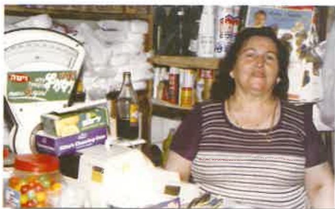
שושנה במכולת כספי